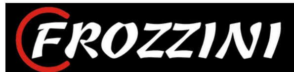
Original Belo Crvena

CMYKcrna – 0/0/0/100 CMYKcrvena – 8/98/100/1 HEXcrna – #000000 HEXcrvena – #DC2727